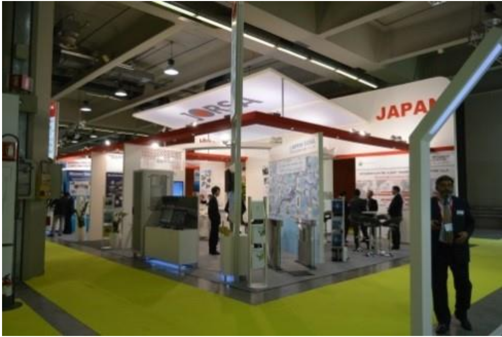
UITP 2015 敝司展區